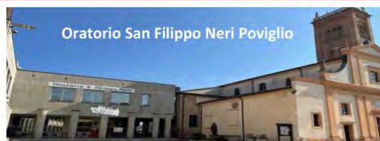
Oratorio San Filippo Neri Poviglio

UNITALSI Castelnovo ne' Monti Piazza Giacomo Matteotti 42035 Castelnovo ne' Monti (RE) Telefono 0522 - 810383 Mail baroni_marcosp@yaho.it